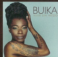
『Vivir Sin Miedo』 (Warner Music Spain)

2017 3.7 TUE. すみだトリフォニーホール 開演 19:00 (開場 18:30)