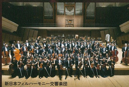
新日本フィルハーモニー交響楽団

アメリカの公共ラジオ局、NPR (National Public Radio)が「史上最高のヴォーカリスト50人」に選出。“The Voice Of Freedom(自由の声)”と評され、フラメンコをベースにジャズ、アフロビート、ソウル、レゲエにHip Hopなどの要素を取り入れた、ボーダレスかつ唯一無二の音楽世界を築くシンガー、ブイカが2017年3月に来日。至近距離で彼女の歌声、世界観を堪能できるクラブでのライブと、オーケストラと共演するコンサートホールでの公演を行う。1972年、ギニア共和国出身の両親のもとスペインのマジョルカ島に生まれたブイカはコプラヤカント・フラメンコが聞こえる環境で育ち、幼少時からその音楽的才能とセンスを発揮。2006年に「Mi Nina Lola」のヒットで注目を集め、'09年の『El Ultimo Trago』でラテン・グラミー賞を獲得。また『La Noche Mas Larga』は第56回グラミー賞のベスト・ラテン・ジャズ・アルバムにノミネート。'11年に公開されたペドロ・アルモドバル監督の映画『私が、生きる肌 (The Skin I Live In / La piel que habito)』では、結婚パーティーでブイカが歌うシーンが強烈な印象を残した。チック・コリア、チューチョ・ヴァルデスとの共演でも注目を集め、'15年にはジェイソン・ムラース、ミシェル・ンデゲオチェロ等を迎えたアルバム『VIVIR SIN MIEDO(恐れることなく生きること)』リリース。ニーナ・シモンやセザリア・エヴォラといった伝説的なシンガーたちとも比較される“自由の声”、ブイカの真髓を体感したい。